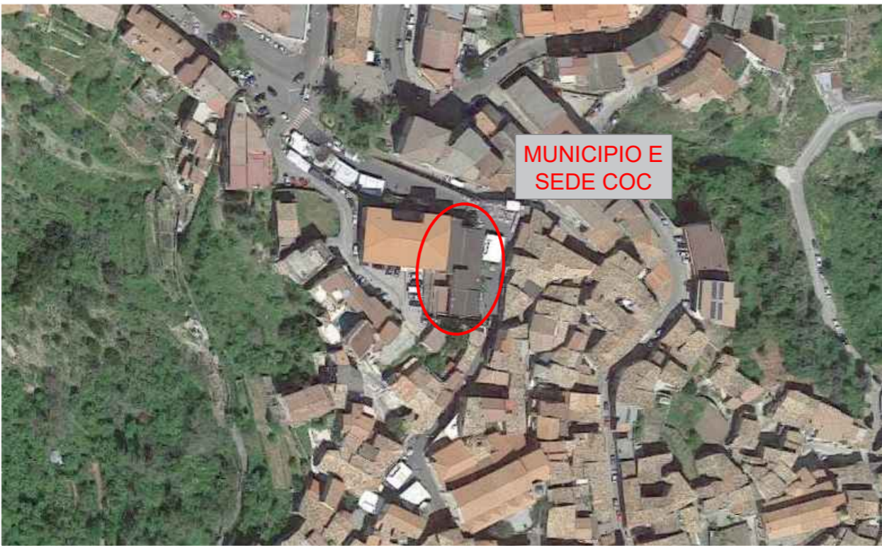
Individuazione del Municipio del comune - oggetto di intervento