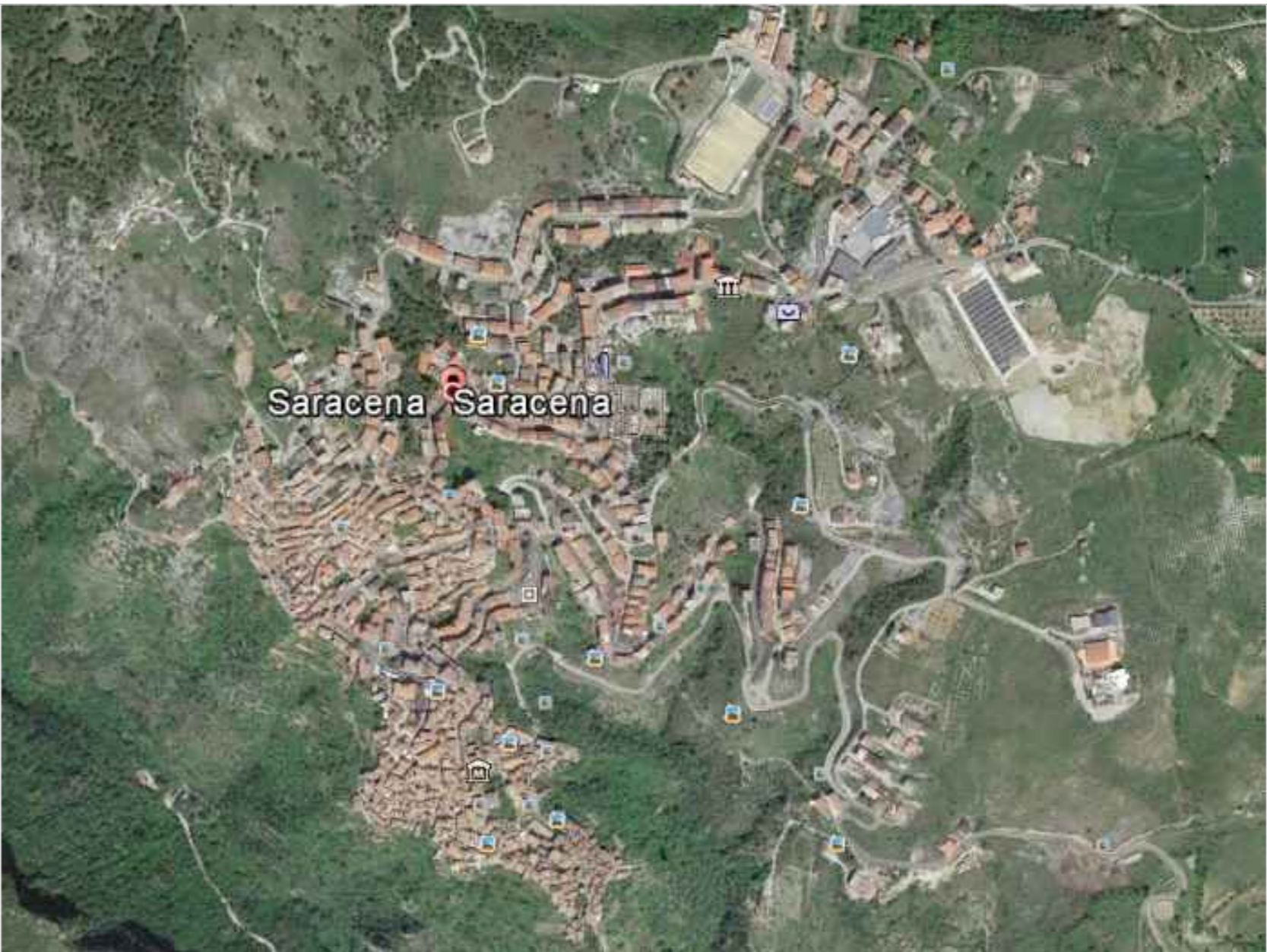
Ortofoto del comune di Saracena