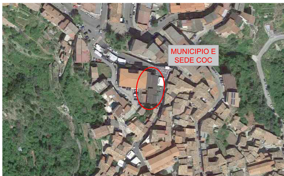
Inquadramento edificio oggetto d'intervento

Il comune di Saracena è un comune italiano di 3 876 abitanti situato nella parte settentrionale della provincia di Cosenza in Calabria, confinante a nord con i comuni di Morano Calabro, San Basile e Mormanno, a est con Castrovillari, a sud con Firmo, Lungro ed Altomonte e ad ovest con Orsomarso. Il mar Ionio dista circa 45 km (lungo la SS 534), il mar Tirreno circa 60 km, la città di Cosenza 69 km. Il fabbricato in esame è ubicato nel centro abitato in Via C. Pisacane n.4 nel Comune di Saracena (CS) ad un'altitudine di circa 692 m.s.l.m.